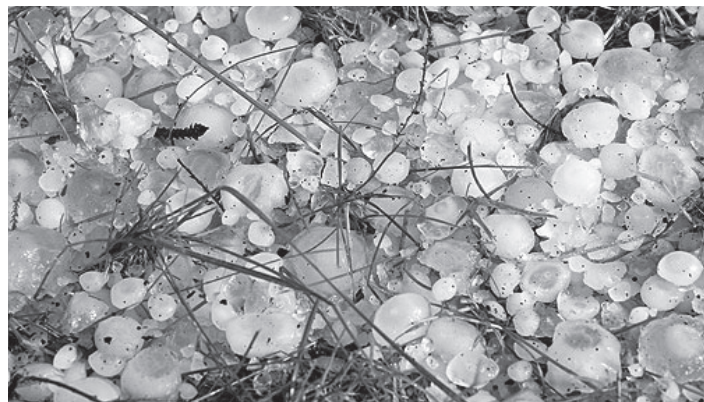
Danni da brina e gelo